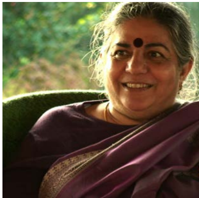
DR. VANDANA SHIVA

« Se penser comme des consommateurs fait partie du problème, retrouver notre identité de créateur et de producteur fait partie de la solution. »