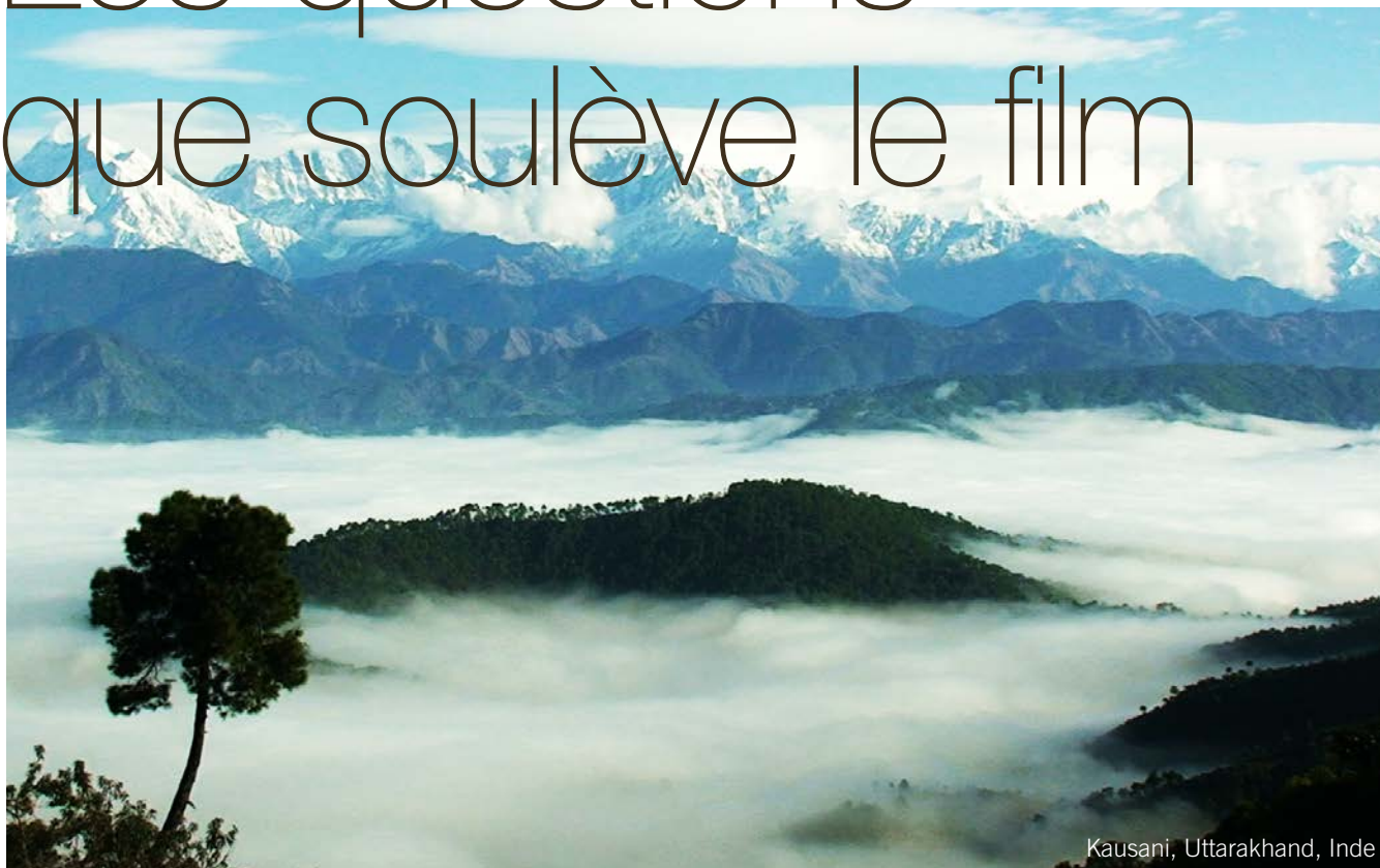
Kausani, Uttarakhand, Inde