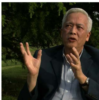
TRINH XUAN THUAN

« Nous sommes interdépendants des étoiles et du cosmos. »